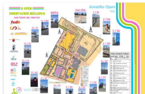
Imagen 3 . Ejemplo Mapa Recorrido Inclusivo I ODI San Pedro del Pinatar