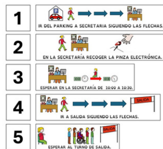
Imagen 2 . Historia social: Antes de la carrera